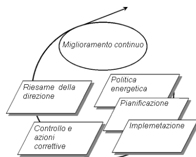
Figura 2 Ciclo PDCA

In particolari settori, inoltre, una corretta gestione energetica influisce notevolmente sull'immagine del prodotto o del servizio offerto e può costituire un fattore differenziante nelle scelte dei consumatori.